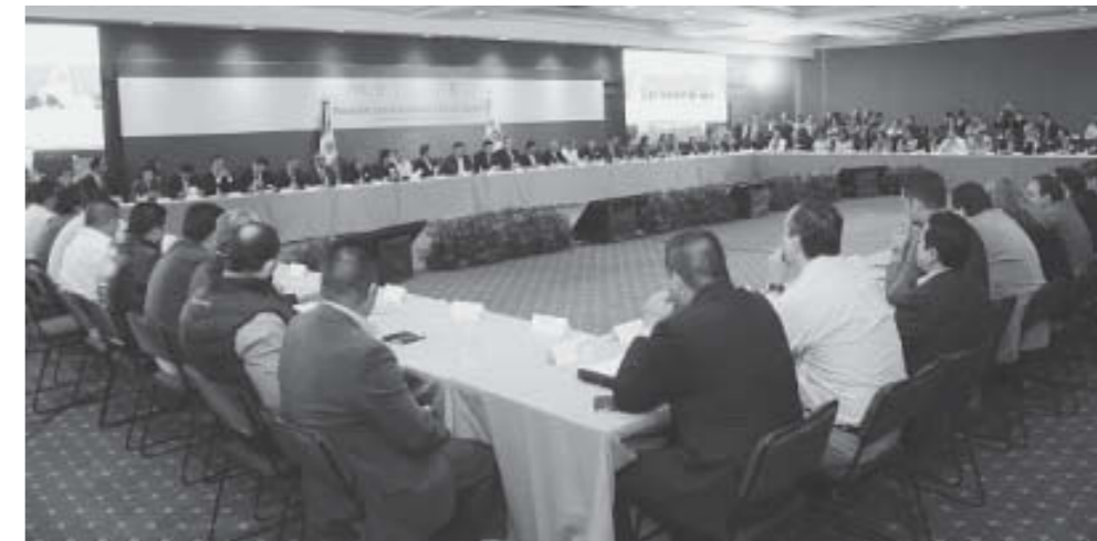
En reunión de trabajo con alcaldes y legisladores insiste en la necesidad de lograr la unidad, así como de emprender acciones más allá de los diagnósticos.

Solicitaron de igual forma, una mayor presencia del gobierno Federal en cada una de las regiones del estado, a fin de fortalecer tanto los programas sociales como los esquemas de seguridad.