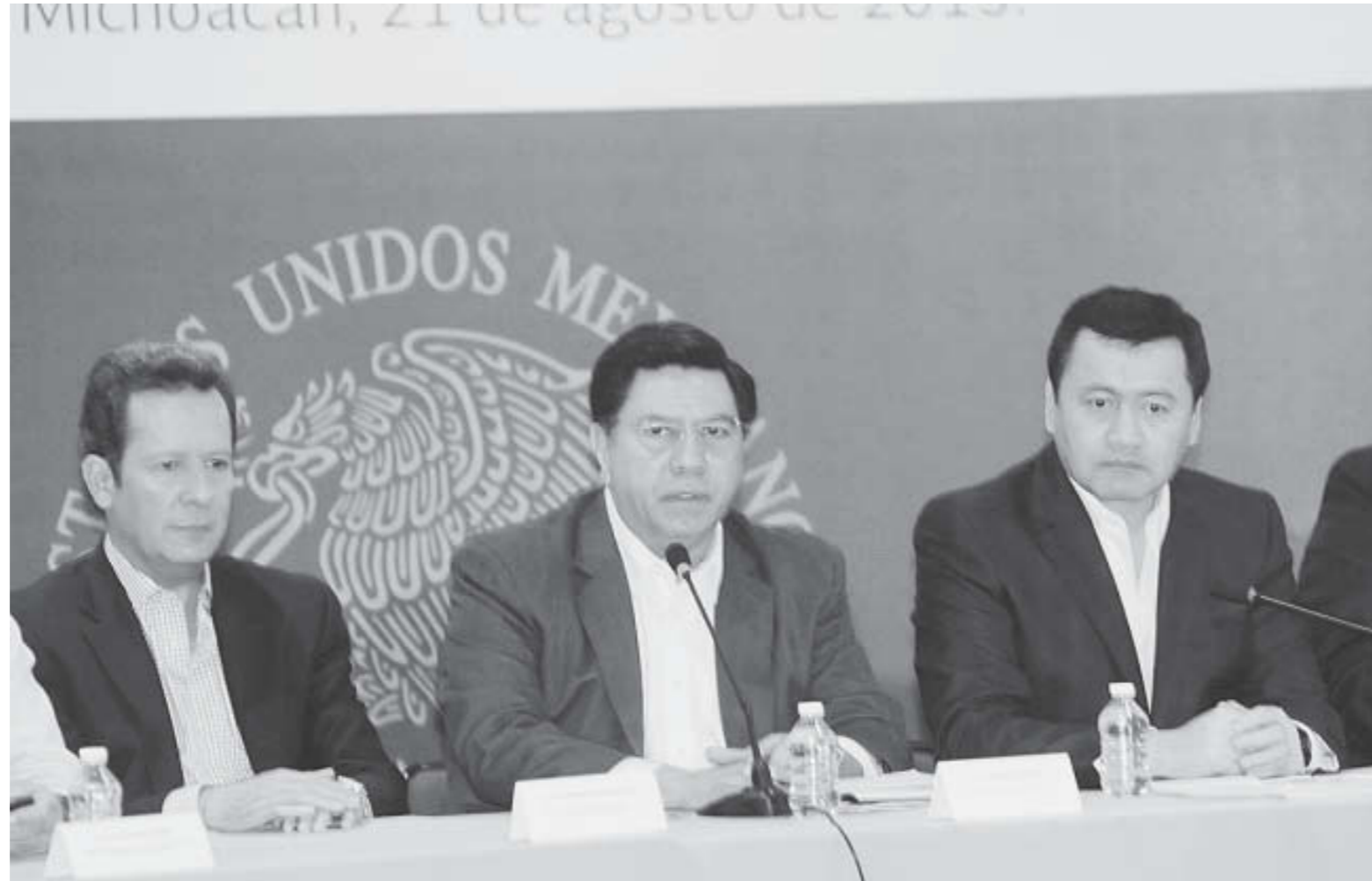
Reitera el secretario de Gobernación, Miguel Ángel Osorio Chong, la permanencia de las fuerzas federales para atender los diversos rubros que detonen el desarrollo en la entidad.

Luego de confirmar que la visita del presidente Enrique Peña Nieto al estado se realizará