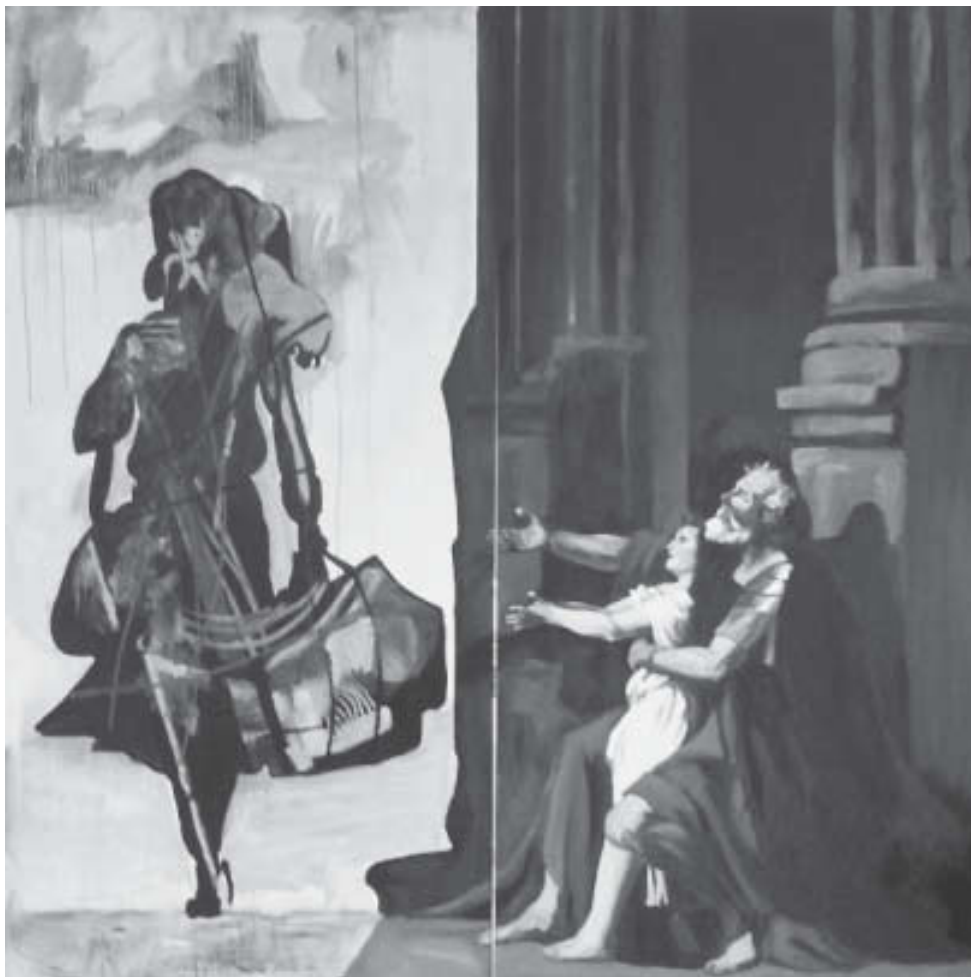
Cuadro del pintor neoclásico francés Jacques-Louis David.

La indiferencia es egoísmo. La primera genera la segunda o viceversa. Pues el egoísta en ese exacerbado amor por él mismo, velando en exceso por su propio interés descuida el de sus semejantes, aún el de aquellos más cercanos a él. Ambas son bestias que inmovilizan el accionar de las personas con las más variadas justificaciones. La indiferencia es a todas luces una acción negativa para el hombre, pues hace que como individuo y como miembro de una sociedad, carezca de responsabilidades y compromisos más allá de los que puedan ser beneficiosos para él exclusivamente.