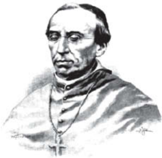
Obispo de Michoacán, don Clemente de Jesús Munguía.

un hombre insignificante por lo que Miramón se hizo nombrar Presidente Substituto y formó un gabinete con elementos moderados que no fueron del agrado del clero. El día 12 de julio Miramón lanzaba un manifiesto que decía: «Las armas del Supremo Gobierno han sido siempre victoriosas en los encuentros y sin embargo nadie se somete y la revolución no se sofoca ¿por qué? porque no basta la fuerza de los ejércitos para consumir una revolución; porque es preciso desarrollar sus principios, es preciso remediar las necesidades que la han determinado y después de ciertas vaguedades prometía resolver la cuestión de la desamortización de los bienes de la iglesia, invocando el sentido recto e ilustrado del venerable clero mexicano. El mismo día, el Gobierno de Juárez, dictaba una de las leyes más importantes de la Reforma: 1.-Entran al dominio de la Nación todos los bienes que el clero secular y regular ha estado administrando con diversos títulos, sea cual fuera la clase de predios, derechos y acciones en que consistan, el nombre y aplicación que hayan tenido. En sus considerandos se exponía con absoluta claridad cuáles eran las causas de los