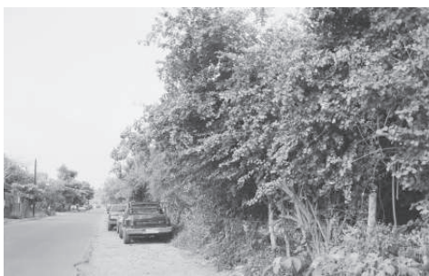
A la vera del ramal Tecomán.

Vayamos recorriendo los paisajes desde el puerto de La Manzanilla hacia Colima. que e el ‘ambito en que se desarrolló Santiago de Tecomán: El paso obligado era por el río Gran-