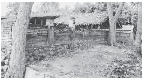
Basamentos del templo de Valenzuela.