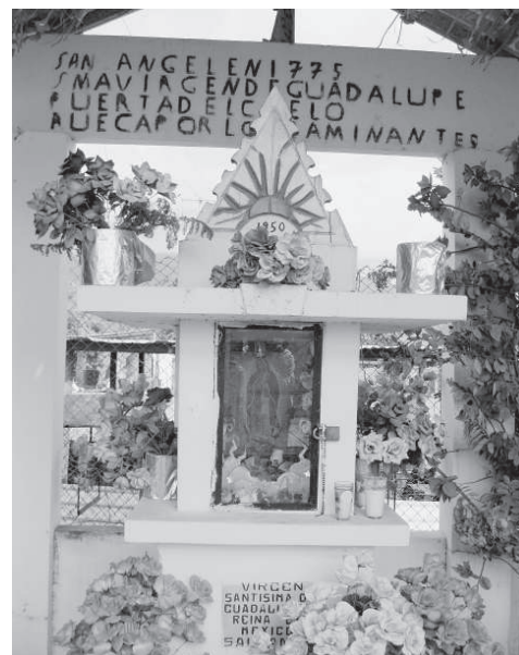
Capillita de San Ángel.