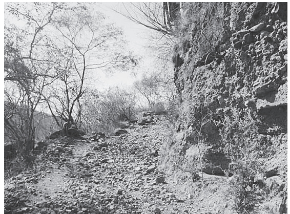
La Cuesta del Ocote Gacho