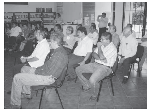
Parte del público asistente a la presentación del número 100 de la revista Crisol de Ideas en el estado de Colima.