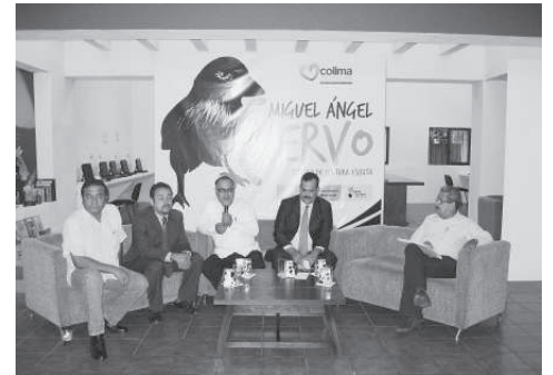
El director fundador de Crisol de Ideas ofreció una charla sobre los alcances de este proyecto editorial entre los amantes de la lectura trascendente.