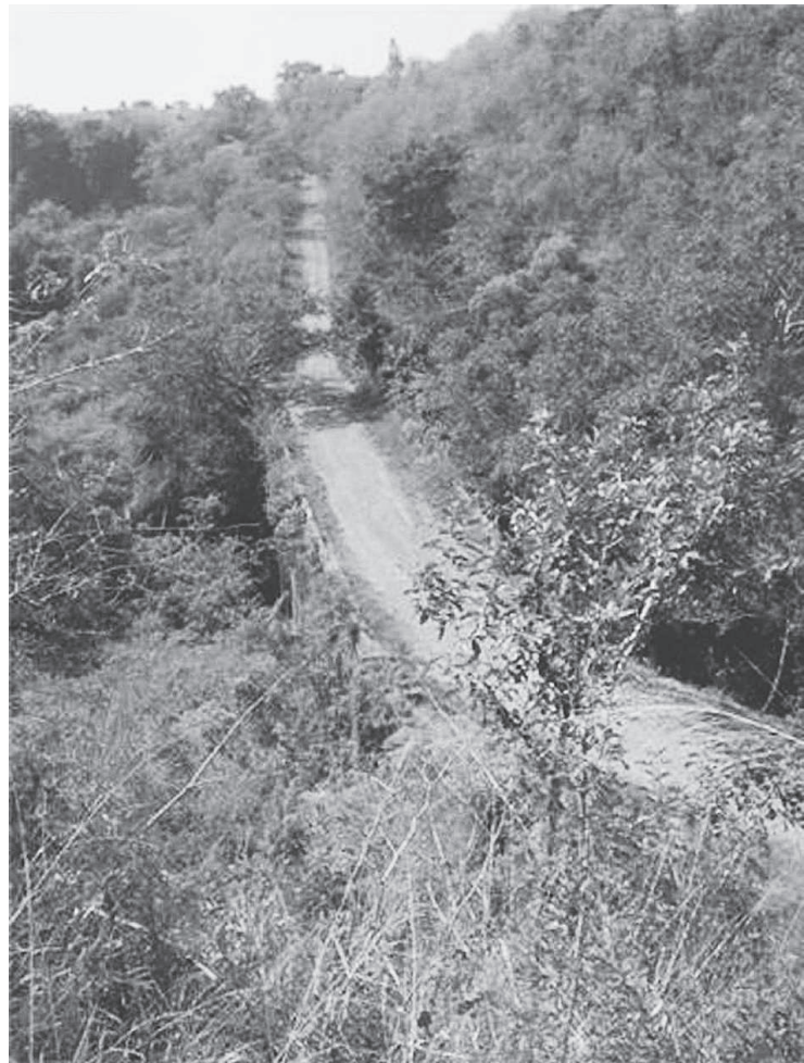
El camino sobre la Barranca del Muerto

«El ferrocarril había hecho su aparición produciendo la sensacional estampida de todos los tiempos». Muchas gracias.