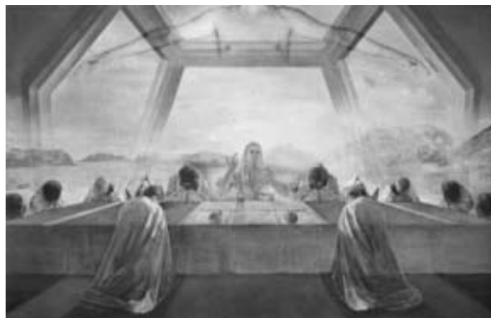
Salvador Dalí: «La última cena»

En el segundo momento se escucha la palabra de Dios, esta parte es de total interpretación personal, aunque después el sacerdote da su interpretación del texto en lo que llaman la «homilía». Le sigue el «credo» que viene a ser una renovación de las creencias, esta oración en tiempos anteriores, sólo se usaba como juramento.