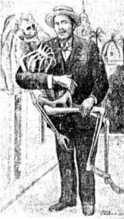
DIBUJOS DEL MTR. JERONIMO MATEO M.