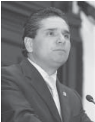
Silvano Aureoles Conejo

Luego las reacciones en los otros partidos no se hicieron esperar. En el propio panismo, Marko Cortés puso el grito en el cielo y paró en seco las declaraciones de su dirigente estatal, pues el actual senador de la República sería el candidato natural de ese partido, por haberse colocado en segundo lugar durante la contienda federal en la que Leonel Godoy Rangel ganó la curul en la Cámara Alta.