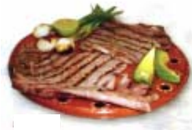
Costilla de Res