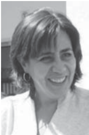
Luisa María Calderón.

Nadie le echa la culpa de la crisis a Calderón, lo que demandan los mexicanos es que la forma de afrontar esa crisis ha fallado, porque el dictador se ha dedicado a fortalecer a las fuerzas armadas y a las policías federales, en lugar de destinar recursos al combate a la pobreza y a la creación de empleos.