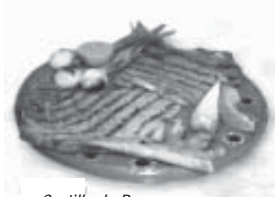
Costilla de Res