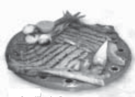
Costilla de Res