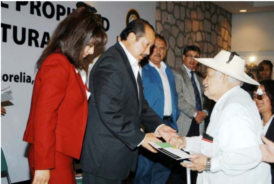
El gobernador Leonel Godoy Rangel entregó 176 escrituras a colonos de los fraccionamientos Tercera Esperanza y Lomas de la Aldea, así como 270 órdenes de escrituración a habitantes de los asentamientos San Isidro Itzicuario y Primo Tapia Poniente.