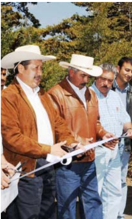
Leonel Godoy Rangel, gobernador del estado, en gira de trabajo por el municipio de Tlalpujahua, inauguró diversas pavimentaciones que le permitirán a los habitantes tener una mejor comunicación entre la cabecera municipal y las comunidades, además de conocer los trabajos de remodelación e iluminación que se realizan en la Plaza Rayón, el Museo Hermanos López Rayón y el Santuario de la Señora del Carmen.