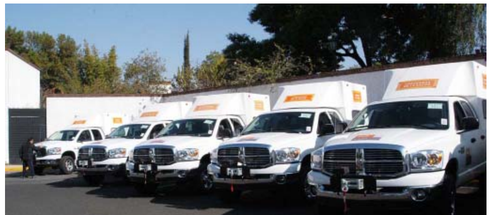
El gobernador Leonel Godoy Rangel entregó a la Secretaría de Salud de Michoacán (SSM) 34 vehículos, en cuya adquisición se invirtieron más de 10 millones de pesos, que se utilizarán para fortalecer las coordinaciones de Protección contra Riesgos Sanitarios y el programa de Caravanas de la Salud.