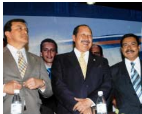
En lo que fue calificado como un hecho inédito, el gobernador Leonel Godoy Rangel asistió al primer informe de actividades del grupo parlamentario del Partido Acción Nacional en la LXXI Legislatura.