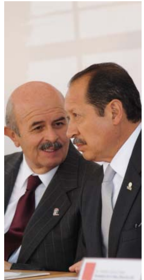
Leonel Godoy Rangel, gobernador del estado y Fausto Vallejo Figueroa, presidente municipal de Morelia, encabezaron el acto con el que se conmemoró el CLII y XCII Aniversario de la Promulgación de la Constitución Política de 1857 y 1917.