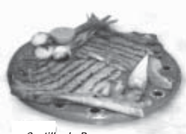
Costilla de Res