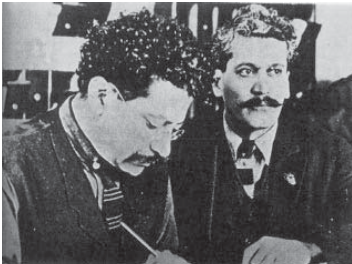
Ricardo y Enrique Flores Magon

A principios del siglo XXI la educación de calidad es un artículo inaccesible para las grandes mayorías; que se tienen que conformar con enviar a sus hijos a escuelas oficiales, donde los profesores asisten poco, porque están ocupados en paros, plantones, marchas y otras actividades alejadas de las aulas; sólo algunos cuantos privilegiados tienen recursos para enviar a sus hijos a las escuelas privadas, de tal manera que el analfabetismo funcional y la ignorancia son aprovechados por la clase en el poder, para seguir explotando a su antojo el trabajo de la grandes mayo-