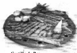
Costilla de Res